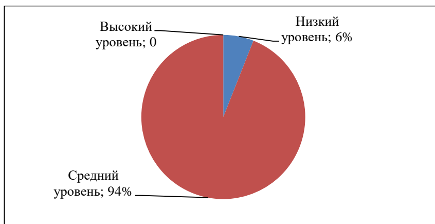
Рисунок 2. Групповая оценка выявленного уровня толерантности

• 94% испытуемых со средним уровнем толерантности. Проявления толерантности у данной группы педагогов имеют место быть, но педагог не всегда способен адекватно оценить педагогическую ситуацию с точки зрения толерантного поведения и возможны, с его стороны проявления нетерпимости к окружающим. Так же учитель может совершать толерантные поступки, испытывая при этом теплые чувства и желание продлить благополучие в классе, но при этом он может встретить препятствия, недопонимание окружающих (коллег, администрации школы) и его стремления угасают (См. рис. 2).