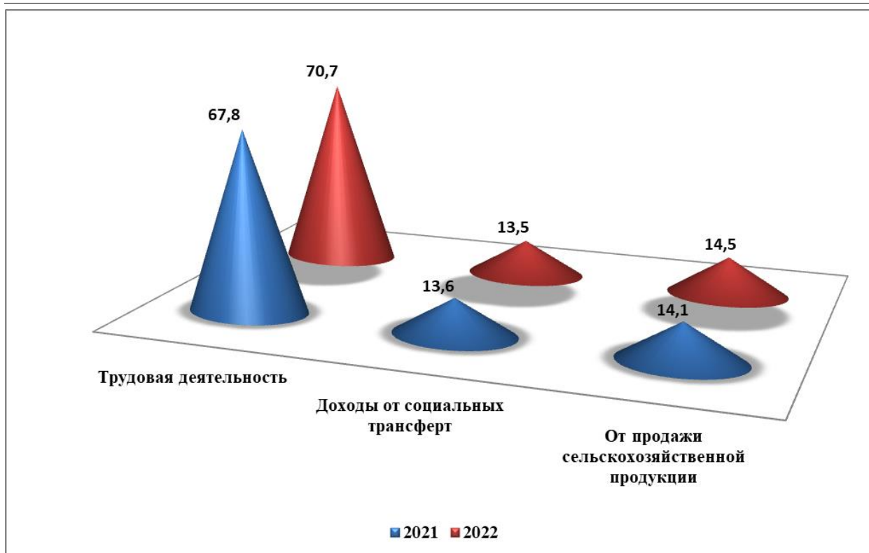
Рисунок 2. Основные источники денежных доходов населения

Среднемесячная номинальная заработная плата одного работника в 2022 году (без учета малых предприятий) составила 25 027 сомов и по сравнению с 2021 годом увеличилась на 27,9 процента, а ее размер с учетом индекса потребительских цен, увеличился на 12,7 процента.